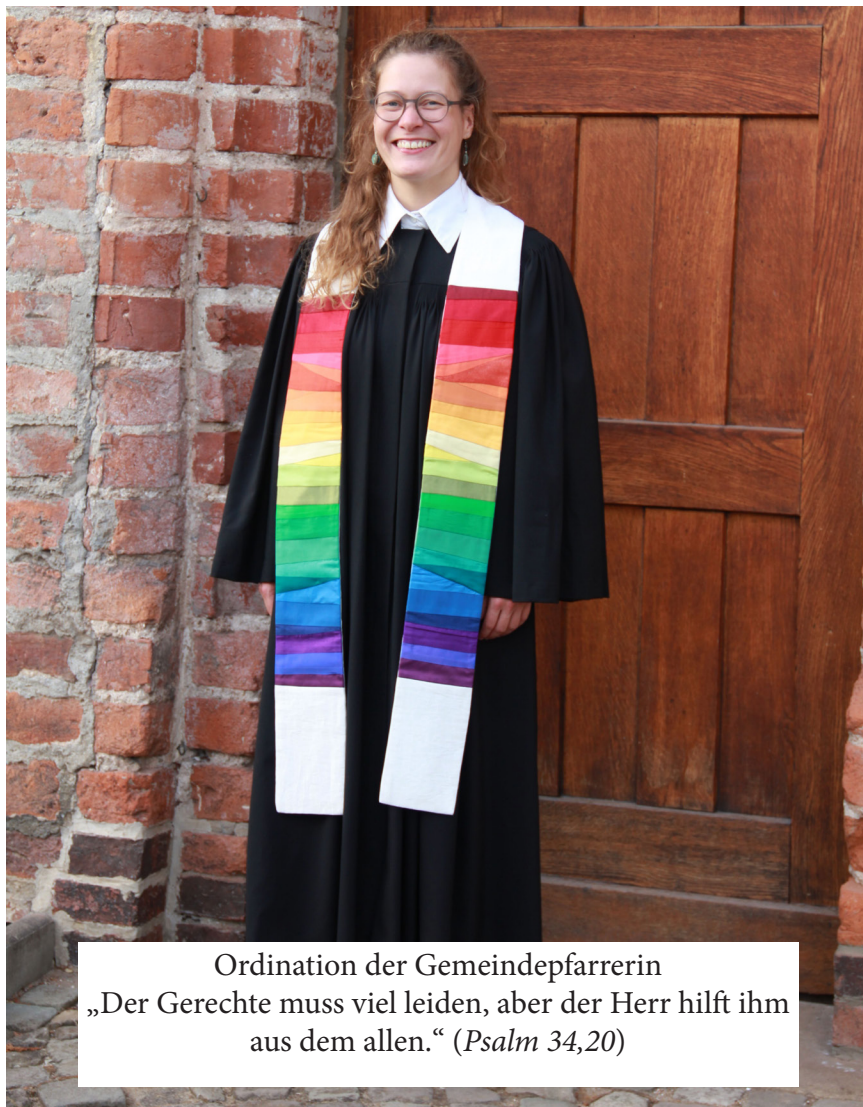
Ordination der Gemeindefarrrerin „Der Gerechte muss viel leiden, aber der Herr hilft ihm aus dem allen.“ (Psalm 34,20)